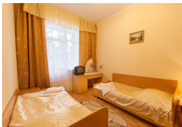
Семейный номер из двух комнат. 33кв

В номере: 2 телевизора, холодильник, с/у оборудован ванной, фен, 2 лоджии(4 пластиковых стула), 4 кровати 1,0*2,0, тумба прикроватная -4, комбинированный шкаф - 2, столик туалетный - 2, стол журнальный - 2, кресло 4 шт., эл.чайник, набор посуды, в прихожей шкаф для верхней одежды.